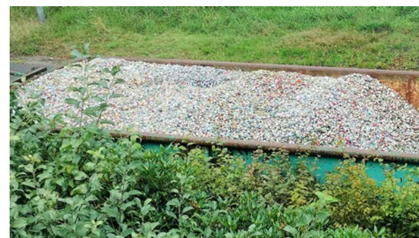
So sehen 5.600 kg Kronkorken aus.

Seit Beginn wurden über 100.000 € eingesammelt.